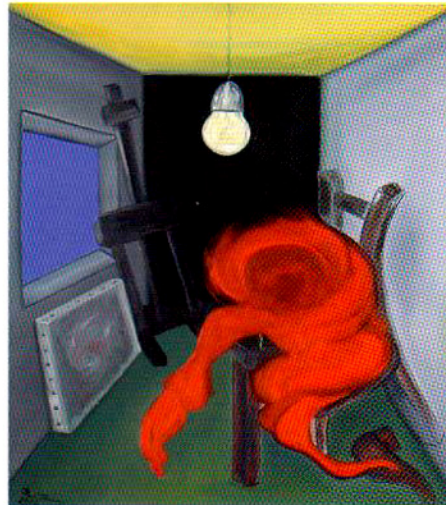
La fatigue du peintre, huile, 2006