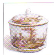
Porcelaine suisse à Prangins Zurich à la quête de l'or blanc