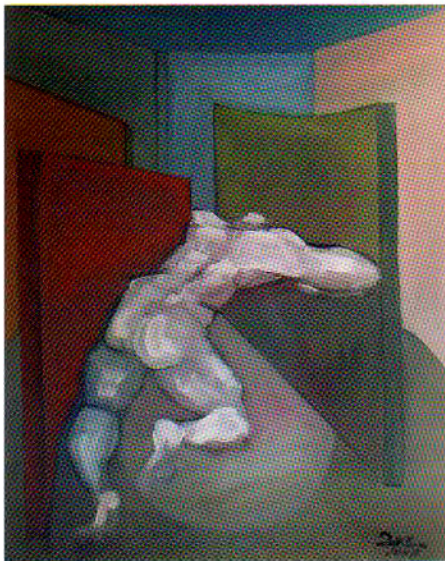
Labyrinthe, huile, 2007